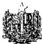
TABELA ANEXA À LEI Nº.208, DE 30 DE NOVEMBRO, DE 1965